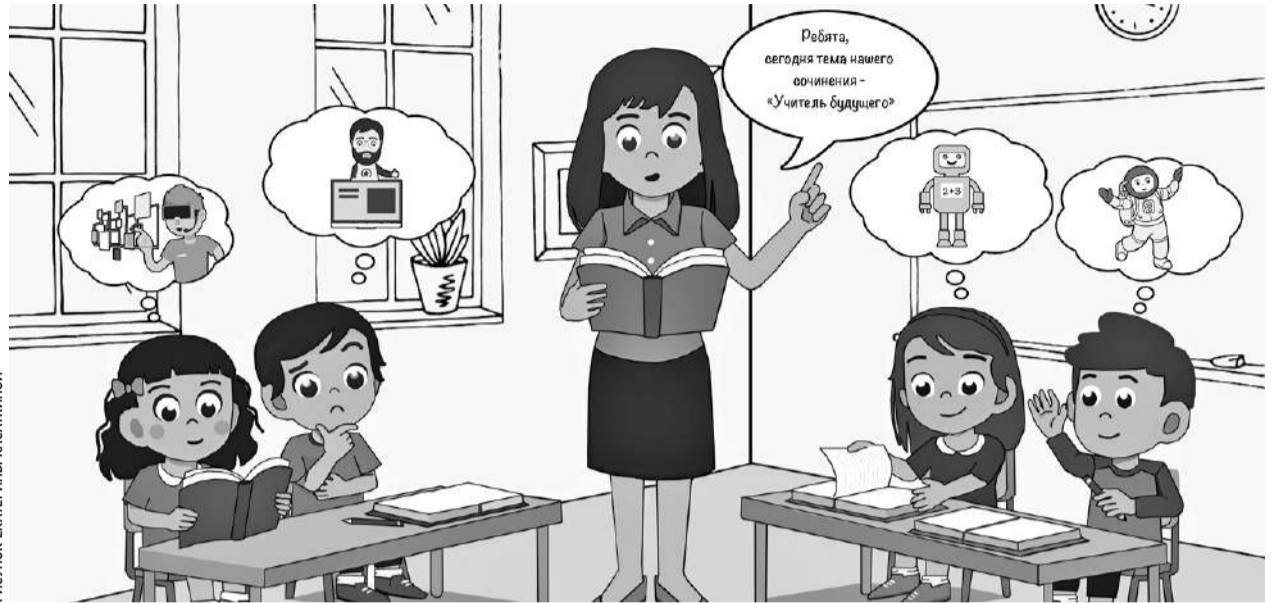
РИСУНОК ЕКАТЕРИНЫ КАСАКИНОЙ

Общая сумма выделенных средств — 10 млн рублей. Из них федеральное финансирование — около 8,5 млн. Почти 1,4 млн —