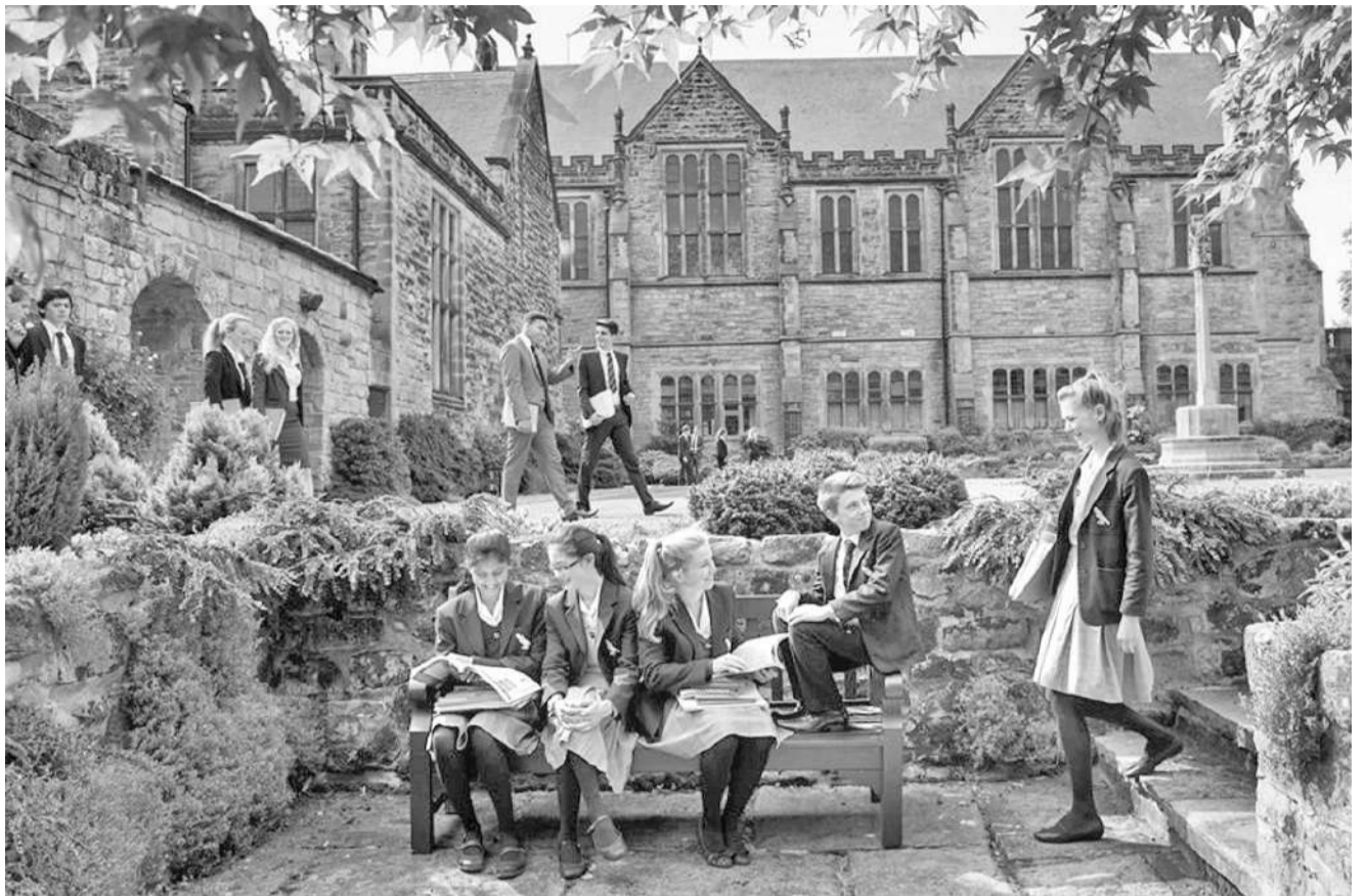
В некоторых канадских школах от формы и не думали отказываться